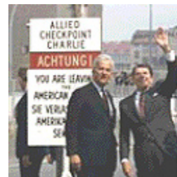
Preserve a monument to freedom