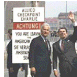
Preserve a monument to freedom